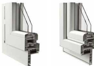
Telaio a Zeta da 58 mm vista interna ed esterna Esempio con anta arrotondata