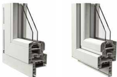
Telaio a Zeta da 38 mm vista interna ed esterna Esempio con anta arrotondata