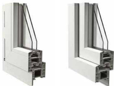
Telaio ad Elle con cornice da 30 mm vista interna ed esterna