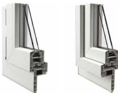
Telaio a Zeta da 75 mm vista interna ed esterna

Disponibile esclusivamente nelle colorazioni: WS Bianco in pasta e GO Golden OAK