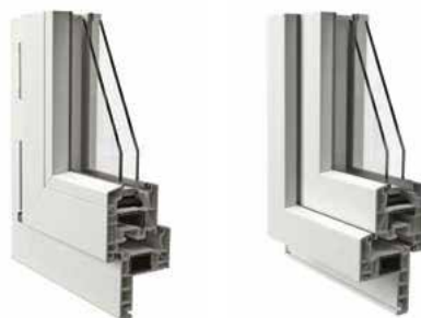
Telaio a Zeta da 50 mm vista interna ed esterna