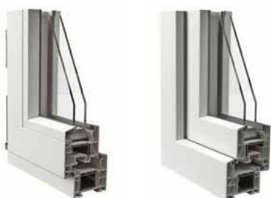
Telaio ad Elle con cornice da 30 mm vista interna ed esterna