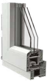
Telaio ad Elle vista interna ed esterna