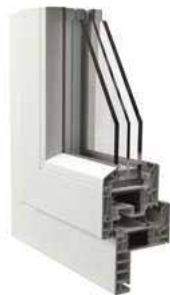
Telaio Zeta da 50 mm vista interna ed esterna