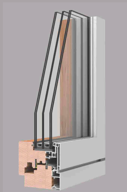
Sistema Slim perfeziona l'estetica del serramento a finestra aperta

Slim è il serramento ideale per tutti i contesti di design minimalista.